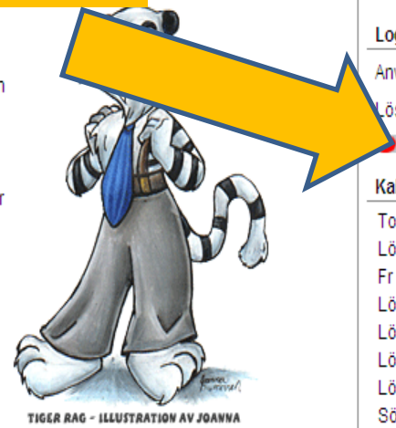
TIGER RAG - ILLUSTRATION AV JOANNA